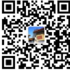
“南林智慧校园” 微信公众号

1.首先，请打开手机微信，搜索并关注“南林智慧校园”微信公众号，或微信扫描以下二维码，关注“南林智慧校园”微信公众号。